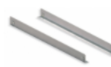
Coppia guide inox "L" Oasis Pastry 62400880 62400880