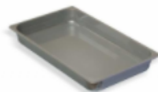
Plaque Aluminium 800x600x20 67300600