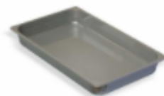
Plaque Inox 800x600x20 67300610